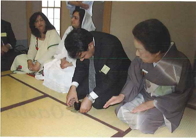
① (財団事務所) 茶道の師範による指導をうけ、日本文化の一端に触れる