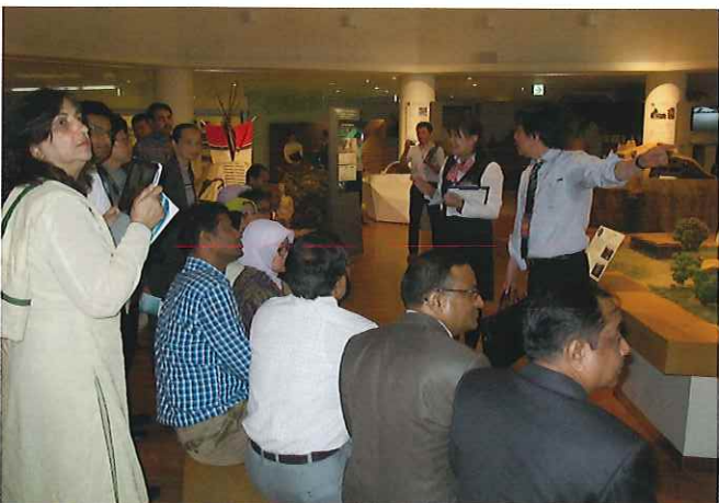
⑦ (大和ハウス工業総合技術研究所) 世界各国の住まいを集めた展示フロアにて太陽の光や風を上手に取り込む家や、台風などの厳しい気象条件を乗り越える工夫がなされた家、木や土といった素材を上手に活用した家を見学。自然と共生する先人たちの知恵を学びながら最新の技術を用い、新しい環境共生住宅の開発方法を知る