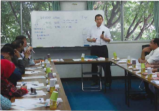
④ (目黒若葉寮) 東京都目黒区大橋にある児童養護施設「目黒若葉寮」では現在45人の子ども達が生活をしている(本園28名、グループホーム17名)。本園にて日本の児童養護についてレクチャーを受けた後、施設内を見学