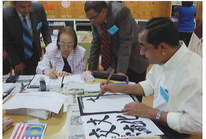
③(白金の森) 特別養護老人ホームの音楽セラピーを見学。高齢者の方々による日本の歌とパキスタンの団員による歌の交流が行われた。デイサービスでは書道などを一緒に体験させていただく