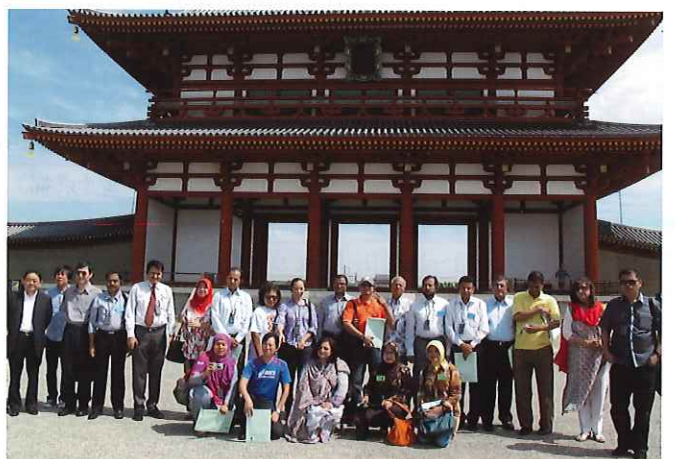
⑧ (平城宮跡) 奈良時代の宮跡として特別史跡に指定され、また世界文化遺産「古都奈良の文化財」を構成する遺跡の一つ。復元された第一次大極殿、平城京資料館、朱雀門などを巡り、先人たちの気概に触れる