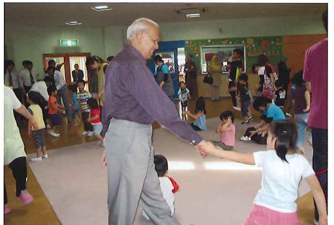
⑥(仔鹿園) 障害のある子ども達の心身の健康な発達を助長し、援助するための療育施設として昭和52年に開設。在宅療育を推進するため長期入所型の施設と家庭との中間的な施設として、障害幼児通園施設、療育相談、研修等の広範囲な福祉サービスを提供。児童発達支援センターでは就学前の障害のある幼児を療育対象とし、ことばや知的発達に遅れや障害がある子ども達に個別の指導や集団保育を行う