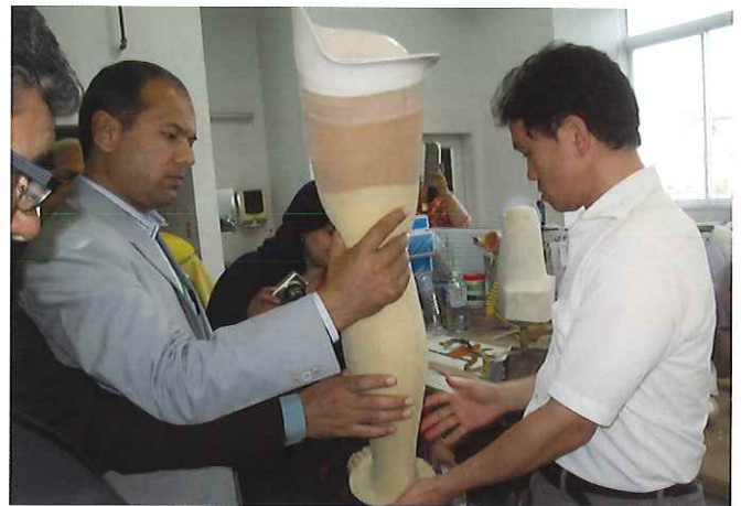
② (義肢装具サポートセンター) 義肢装具の製作から装着訓練までを行う総合リハビリテーション施設として一般の方の日常生活への復帰支援、パラリンピック選手へのスポーツ義足の提供などを行う