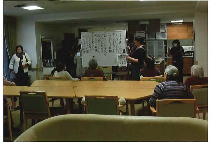
② (レクロス広尾) 最新型特別養護老人ホームを訪問。デイケアの様子や施設内を見学したり、認知症の特性などについてレクチャーを受ける