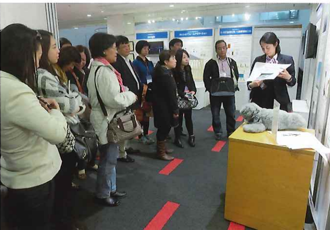
⑦ (大和ハウス工業総合技術研究所) ユニバーサルデザインの植物栽培ユニットの開発では、年中快適でしゃがまずに農作業ができる利点から障害者や高齢者も作業ができるのではないかと問い合わせが殺到しているという。先進的な技術を以て障害者・高齢者を支援する企業の姿勢を学んだとの感想があった