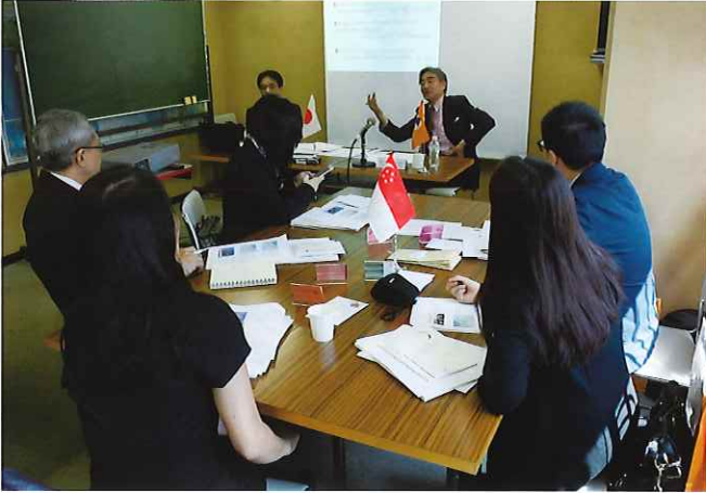
① (講義) 神山難民事業本部長 (当時) より日本の難民受入れについて講義を行う。難民への定住支援の内容について多くの質問があった