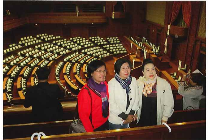
⑤ (国会) 国会議事堂を見学。衆議院の本会議場では、議員の人数や衆議院・参議院の活動や役割について質問があった