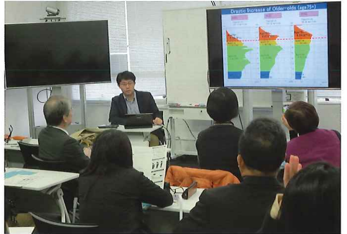
③(東京大学高齢社会総合研究機構)都市計画専門家である特任講師より、今後の日本の超高齢社会を見据え、活力ある高齢社会を創造するための衣食住および活力ある都市について現在進められているプロジェクトを中心に講義を受ける