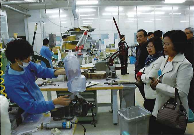
④ (義肢装具サポートセンター) 義肢装具の製作から装着訓練まで一貫してサポートする総合リハビリテーション施設。作業所を見学した際に、技術者より製作方法をうかがうことが出来た