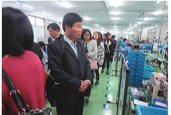
⑥(太陽の家)障害者が働くうえで「社会福祉法人太陽の家 京都事業本部」が健康管理や生活指導を、「オムロン京都太陽株式会社」が生産や技術指導のサポートを行う。電子機器部品や制御機器の組立現場では、平等な雇用の機会がある職場を見学でき有益であったとの感想があった