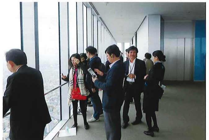
⑧ (ハルカス300展望台) あべのハルカスはビルとして高さが日本一であり、百貨店、ホテル、オフィス、美術館、展望台など多彩な施設が共存する「立体都市」として開発された。地上300mの展望台から広く大阪の眺望を楽しむ