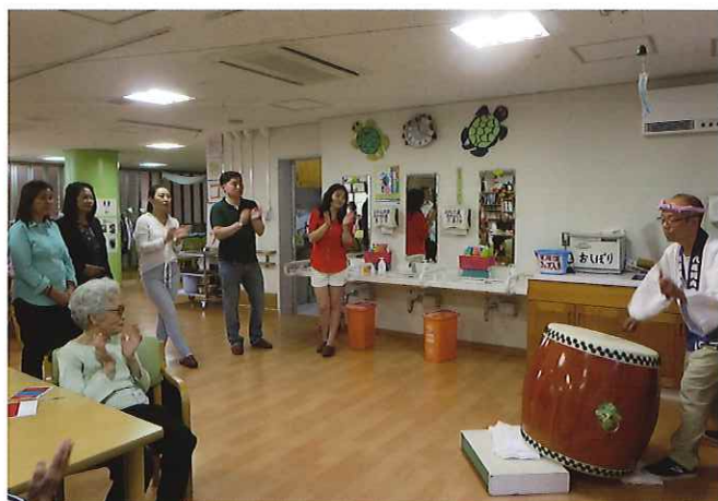
⑤ (白金の森) 東京都港区の特別養護老人ホーム白金の森にてデイケア・デイサービスの現場を見学する。利用者の方々が生き生きしてワークショップを楽しんでいるのが印象的であった