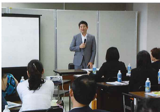
⑧ (奈良市) 奈良市は1972年全国に先駆け「福祉都市宣言」を行い「福祉憲章」を制定し、積極的な福祉施策の拡充を推進している。仲川市長(写真中央)から歓待のご挨拶をいただいた後、保健福祉部長並びに子ども未来部長より、各種福祉施策について講義を受ける