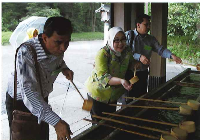
④ (明治神宮) 日本の文化、慣習、古来の信仰を学び理解が深まった