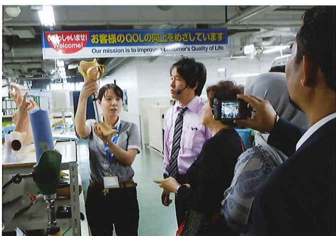
⑦ (川村義肢) 義肢装具から住宅改修まで幅広いサービスを行っている。研修では義肢装具や車椅子、リハビリ機器を製造する日本最大規模の工場を見学したのち、福祉用具ショールームにて様々な福祉用具を体験する