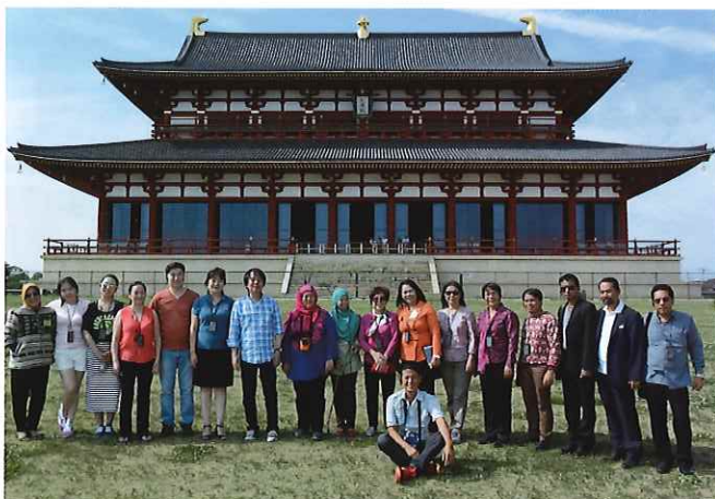
⑥ (平城宮跡) 奈良時代の宮跡として特別史跡に指定されるほか、世界文化遺産「古都奈良の文化財」を構成する遺跡の一つ。復原された第一次大極殿、朱雀門などを巡り、先人たちの気概に触れる