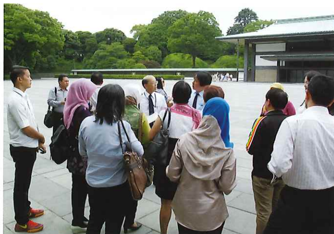
③ (皇居) 宮殿、大道庭園、馬車庫などを特別に参観し、皇室文化への理解を深める