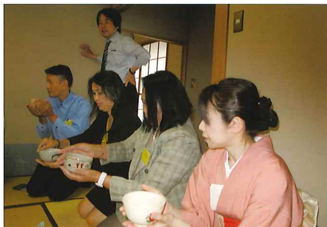
② (日本文化体験) 茶道の師範による指導をうけ、日本文化の一端に触れる