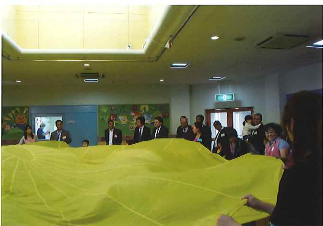
⑦ (奈良仔鹿園) 障害のある子ども達の心身の健康な発達を助長し、援助するための療育施設。障害幼児通園施設、療育相談、研修等の広範囲な福祉サービスを提供。児童発達支援センターでは就学前の障害のことは知的発達に遅れや障害がある子供たちに個別の指導や集団保育を行う