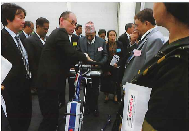
④ (大和ハウス(株) ロボット事業推進室) 大和ハウスでは身体に障がいのある人や身体機能が弱くなった高齢者に希望を与え、いきいきと心豊かに暮らせるきっかけとなるロボット事業を新たに展開。プレゼンテーション後、東京本社内、介護福祉機器展示場「D's TETOTE」にて免許式リフト POPO 等を体験する