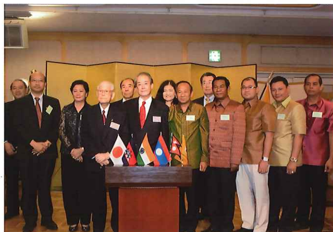
② (歓迎レセプション) シェラトン都ホテル東京にて歓迎レセプションを開催。カンボジア大使、ネパール大使はじめ各国大使館、外務省、福祉関係者の方々など約80名にお越しいたごき、当財団より事業協力への謝意を述べる