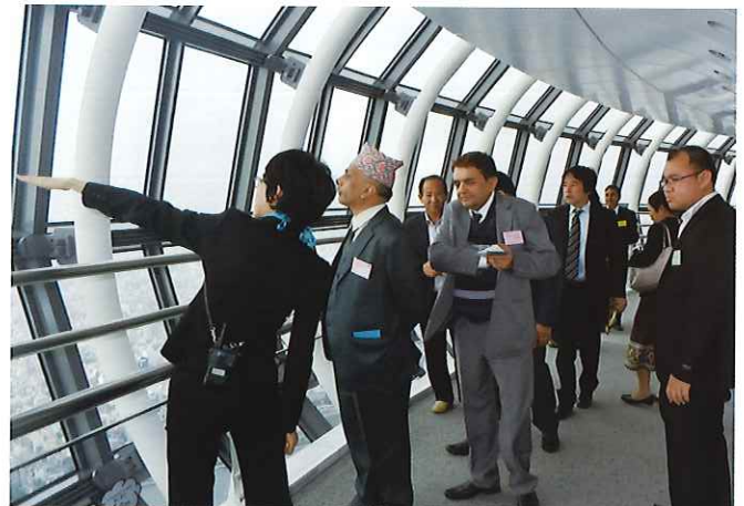
③(東京スカイツリー)「そり」や「むくり」といった伝統的日本建築と最新技術に支えられたデザイン等についてプレゼンテーションを受けた後、天望デッキと天望回廊を見学。高速エレベータの性能や天望回廊からみる街並みに歓喜の声があがる