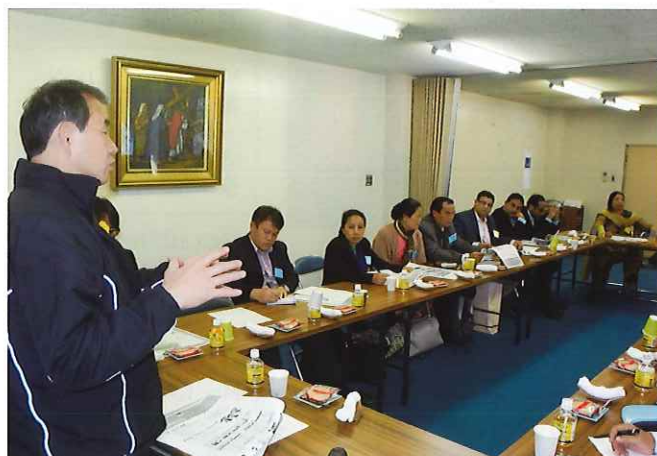
⑤ (目黒若葉寮、氷川ホーム) 愛隣会は東京都目黒区にある高齢者ホーム、高齢者在宅サービス、グループホーム、障害者支援施設、保育所、児童施設を運営する総合的な社会福祉法人。児童養護施設と軽費老人ホームの事業説明の後、それぞれの施設を見学する