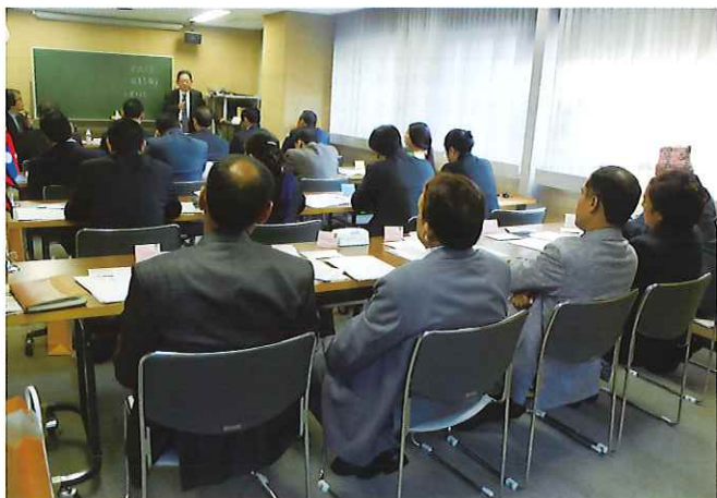
① (オリエンテーション) 研修の初めに当財団事務局長より、日本の歴史、文化、伝統の概要、研修の趣旨などを説明。熱心に耳を傾ける参加者