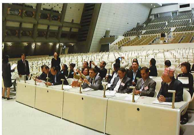
⑧ (国立京都国際会館) 日本で最初の国立国際会議場。1997年地球温暖化防止京都会議「京都議定書」の採択、2012年世界遺産条約採択40周年記念最終会合など16,000件以上に及ぶ会議・イベントを開催し、日本の国際会議の歴史とコンベンションの基盤をつかった