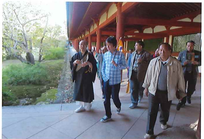
⑥(東大寺)言わずと知れた聖武天皇が造顕されたお寺。その後光明皇后は法華寺を興し貧しい人に施しをするための施設「悲田院」、医療施設「施薬院」を設置して一般の人々のために尽くされた。わが国の社会福祉事業の発祥の地である東大寺の国宝大仏殿にて一般に許可されていない大仏の蓮台まで案内してもらい、僧侶から懇切な説明をうける