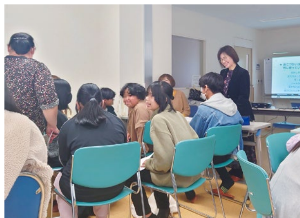
「親子企画！ お金について学ぼう」（12月2日）でのグループワーク

なお、2022年度に、日本語指導が必要な外国人児童・生徒に対して、日本語能力の測定ツールである「外国人児童生徒のためのJSL対話型アセスメント（DLA：Dialogic Language Assessment for Japanese as a Second Language）」を使い、「楽校」