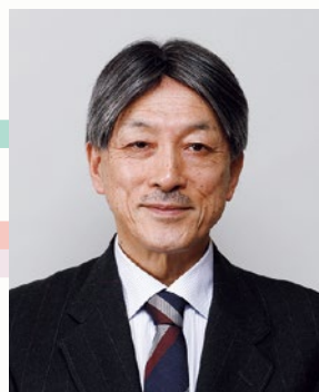
公益財団法人アジア福祉教育財団 事務局長