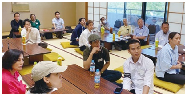
来年のイベントに向け、実行委員会を立ち上げて話し合いを続けています。