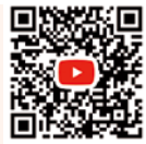
コンテストの様子は こちらから

今回のテーマは「難民をルーツに生きる」。多数の応募の中から最終選考に残った5チームが素晴らしいプレゼンテーションを披露してくれました。難民もしくは難民をルーツに持つ若い世代の参加者が、日常に生じる葛藤や困難、仲間との出会い、様々な活動を通じて見いだした希望、共生社会に向けた思いなどを熱く語ってくれました。