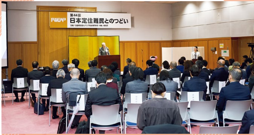
The 44th Festival for Settled Refugees in Japan