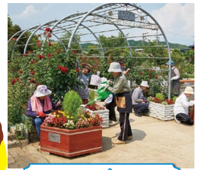
フラワープランター