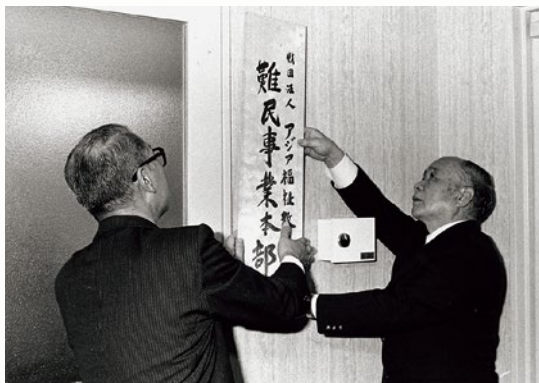
難民事業本部の設置が決まり、昭和54年（1979年）11月2日に開所される