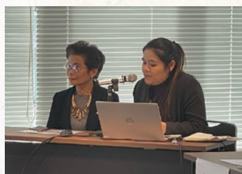
■タイ 少子高齢化が進む社会での福祉の実現