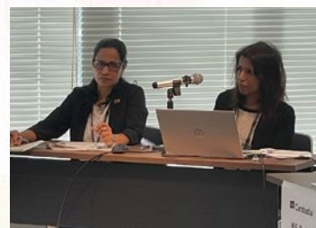
■スリランカ 福利厚生、社会的格差、高齢化への対応