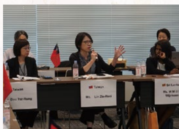
■台湾 出生率向上のための戦略プラン