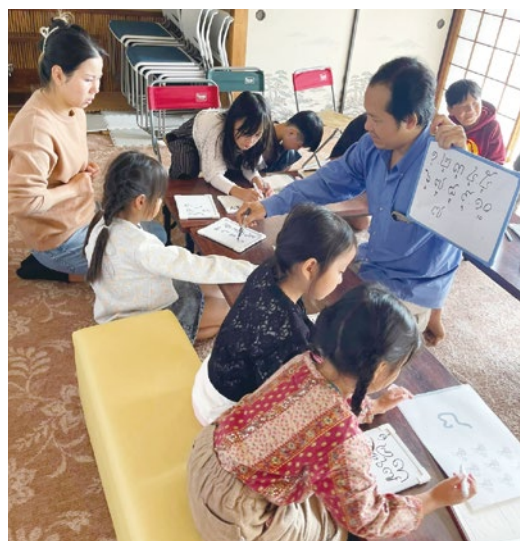
カンボジア(クメール)語教室