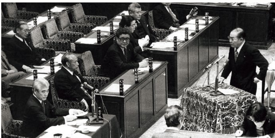
昭和53年(1978年)2月14日の衆議院予算委員会にて奥野議員の質問に答える園田外務大臣

こうして日本政府によるインドシナ難民の受け入れは現実のこととなり、1979年2月には外務省内に「東南アジア難民問題対策室」が設置され、同年4月には閣議にて「インドシナ難民の定住対策」が了解されます。その了解にてまずは500人のインドシナ難民の定住枠が設置さ