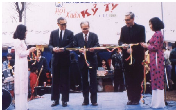
創立当時 新年交流会の開会式

父は生活の基盤を築き、1987年に母と私たちきょうだい6人を呼び寄せました。姫路定住促進センターに入所しましたが、言葉も習慣もわからず、私はずっと