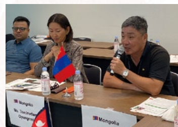
■モンゴル 非電化居住地域からの改善へ向けて