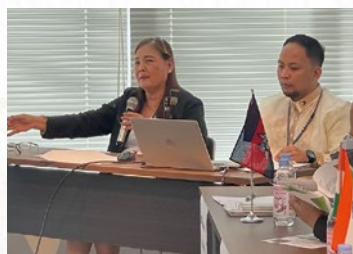
■フィリピン 自然災害への備えとリスク管理法制