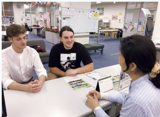
ウクライナ避難民支援の様子（公益財団法人千葉市国際交流協会）

そこで、本市では生活支援一時金を支給するとともに、中長期的に市内で安心して生活していただけるよう、令和4（2022）年5月にウクライナ出身の千葉市民を千葉市国際交流協会の外国語相談員として採用し、外国人相談窓口（ワンストップ相談窓口）の対応言語を拡充しました。現在では、この職員を訪ねて相談窓口に来る避難民も多く、時には医療機関に同行して受診時の通訳を行うなど、市内で生活する避難民の心の支えになっています。