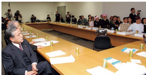
「連邦記念日」に合わせ、各民族の代表を本国から招聘、日本の国会議員への現状説明会

はい。半年間をかけて、先に日本に逃れてきていたミャンマーの少数民族のリーダーを一人ひとり訪問し、2003年に在日ビルマ連邦少数民族協議会（AUN）を