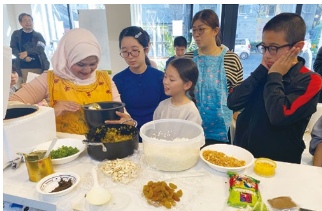
食を通じてのロヒンギャ民族理解セミナー