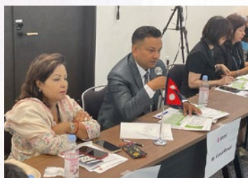
■ネパール 気候変動が女性の生計に与える影響