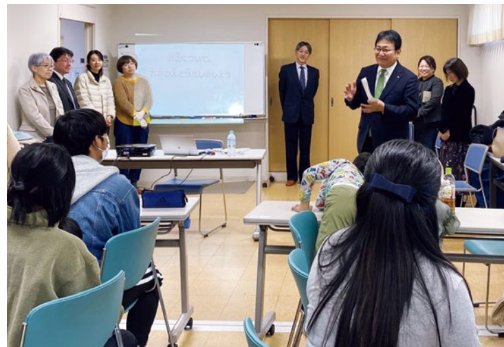
市内の難民児童・生徒に対する補習教室を視察 (難民保護者に向けて挨拶する神谷千葉市長。正面左端は(社福)さぼうと21の高橋理事長)

難民を受け入れています。平成27(2015)年からの第5陣、第6陣、第7陣(15世帯55人)に加え、令和5(2023)年3月に第12陣(4世帯14人)を受け入れており、本市の受け入れ数は全国市町村で最も多くなっています。