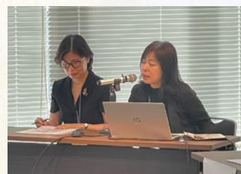
■ベトナム 人口動勢の概況と対策

夜には各国大使や関係省庁等の招待者と招聘者が一堂に会し、 歓迎レセプションを開催しました。