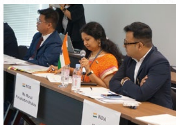
■インド インドにおける高齢者問題