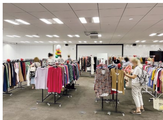
民間企業によるウクライナ支援（QVCジャパン） 品質・デザイン等を事前に確認するために商品供給会社から提供されたサンプル品を、ショッピングの楽しさを感じてもらえるように陳列し、自由に持ち帰ってもらいました。

ウクライナ避難民の受入れ支援では、民間企業によるアパレルや生活雑貨の寄附、映画「ひまわり」の特別上映会の開催、地域のこども食堂等の主催による交流会開催、ウクライナ語及びロシア語のボランティア通訳の登録や活動による支援、ふるさと納税による寄附とAmazonほしい物リストによるAmazonギフト券の寄附など、全国の多くの皆様から温かいご支援をいただきました。Amazonギフト券は「少しでも平穏を取り戻せますように」「千葉でゆっくりし