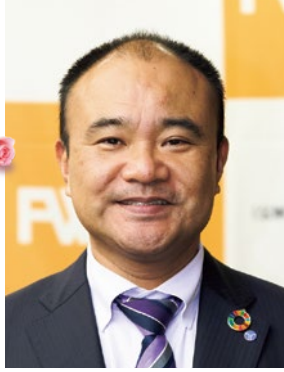
東洋電機株式会社 代表取締役 社長執行役員