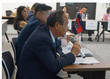
■カンボジア カンボジアの社会保障制度の変遷

同じアジア地域であっても状況がそれぞれ異なるため、共通の問題だけではなく独自の問題も提起され、発表後には活発な質疑応答が行われました。